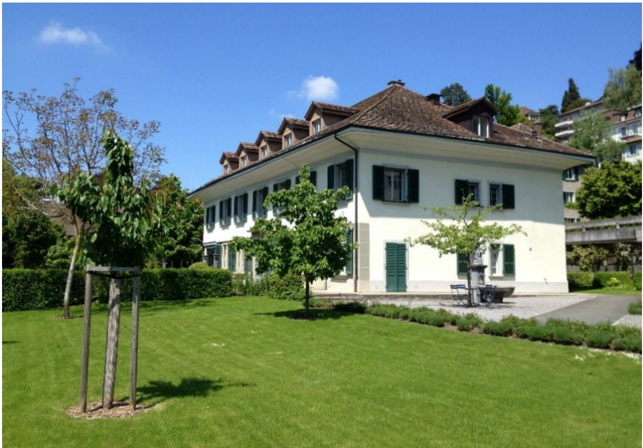
Notre secrétariat à l'Altenbergstrasse 29 à Berne

Editeur: SGPP/SSPP, Altenbergstrasse 29, Case postale 686, CH-3000 Berne 8 Tél. 031 313 88 33, sgpp@psychiatrie.ch , www.psychiatrie.ch Texte: Réuni et composé par le secrétariat de la SSPP Lay-out: Secrétariat de la SSPP Tirage: Le rapport annuel est mis à disposition des membres de la SSPP sous forme électronique. Langues: Allemand et français